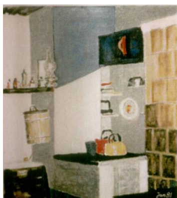
< Z lewej : Kuchnia w Chałupie w Kopańcu