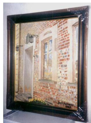
Z prawej: > „Optymistyczne wejście do Towarzystwa Naukowego Płockiego”