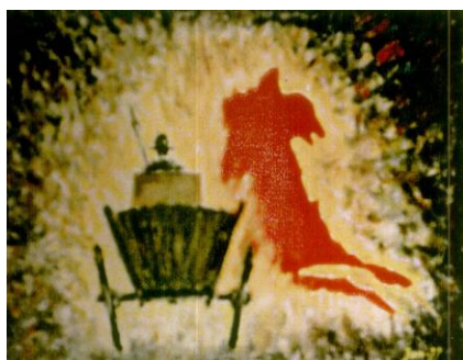
< Z lewej: Ilustracja do wiersza „Ocean barw”.