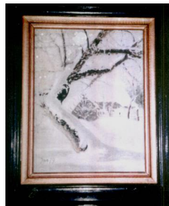
Z prawej: > Zima stulecia w Kopańcu (Widziana przez okno chałupy)