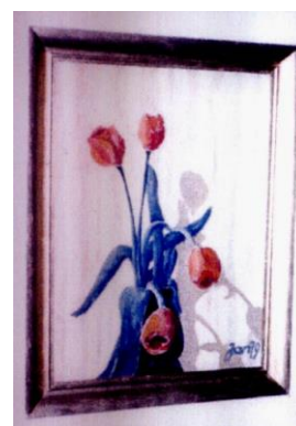
Z prawej : > „Martwa natura”